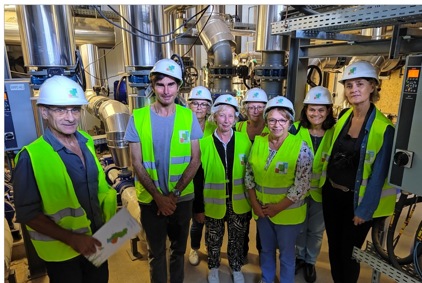
Visite de l'usine Cristal à Carrières-sur-Seine